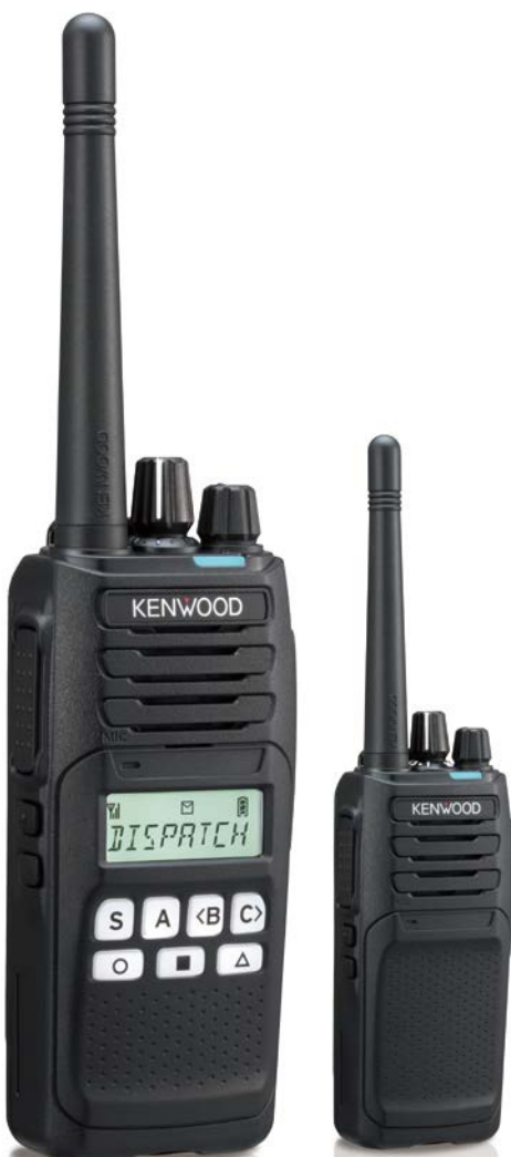
Модель з стандартною клавіатурою

Якщо ви плануєте скористатися сучасними цифровими протоколами - NXDN або DMR для підвищення ефективності роботи або аналоговим для її простоти - радіостанції NX-1200/1300 забезпечать Ваші вимоги. Наше універсальне рішення "все в одному" пропонує найширший вибір двостороннього радіозв'язку для щоденного використання. Модельний ряд включає як базову, так і клавіатурну моделі, без/з висококонтрастним РК-дисплеєм з підсвічуванням. Найявний 7-кольоровий світлодіодний індикатор та 2-контактний роз'єм для аудіо аксесуарів KENWOOD. Крім того, змішаний режим забезпечує безперешкодну інтеграцію зі старим парком радіостанцій, забезпечуючи їх плавну міграцію до цифрового. Незалежно від Ваших потреб, якісне аудіо – це те, що забезпечує ідеальну комунікацію та дозволяє використовувати радіостанції KENWOOD навіть у виснажливих умовах кабіни гоночного боліда. Завдяки великому досвіду роботи з професійними системами, в радіостанціях забезпечена неперевершена надійність. KENWOOD NX-1200/1300 запропонує єдину платформу з широкими можливостями, які необхідні саме вам.